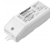
MEGAMAN® LED AR111