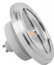
MEGAMAN® LED AR111